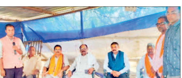
हरिभूमि न्यूज >>> गैंगपुर